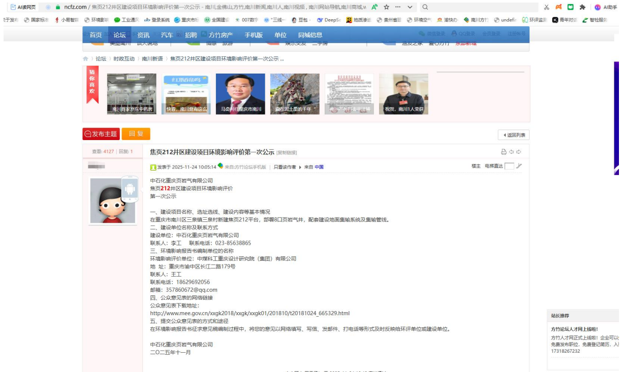
图 2.2-1 第一次网上公示