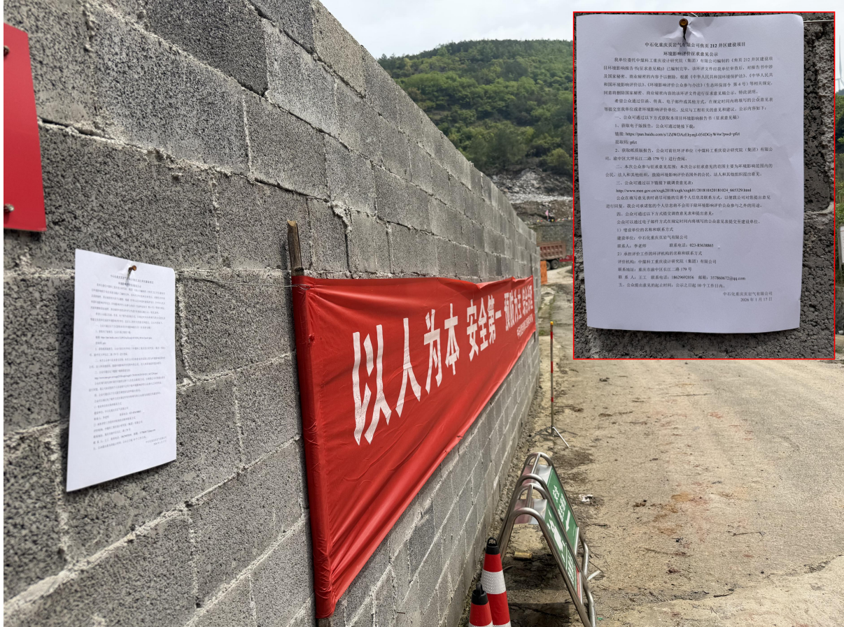
图 3.2-3 现场张贴

我单位于 2026 年 1 月 17 日在平台的周边居民点进行了现场公示张贴，其周边村民、政府、企业等是本项目主要的征求意见的公众范围，公告张贴于居民点，公示位置显眼、突出。