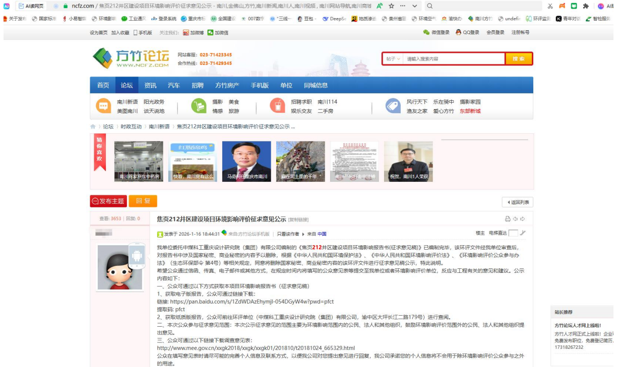
图 3.2-1 征求意见稿网上公示截图

我公司于2026年1月16日通过方竹论坛网站（ https://www.ncfz.com/forum.php?mod=viewthread&tid=3350323 ）进行了征求意见稿内容公示，公示网页截图如下：