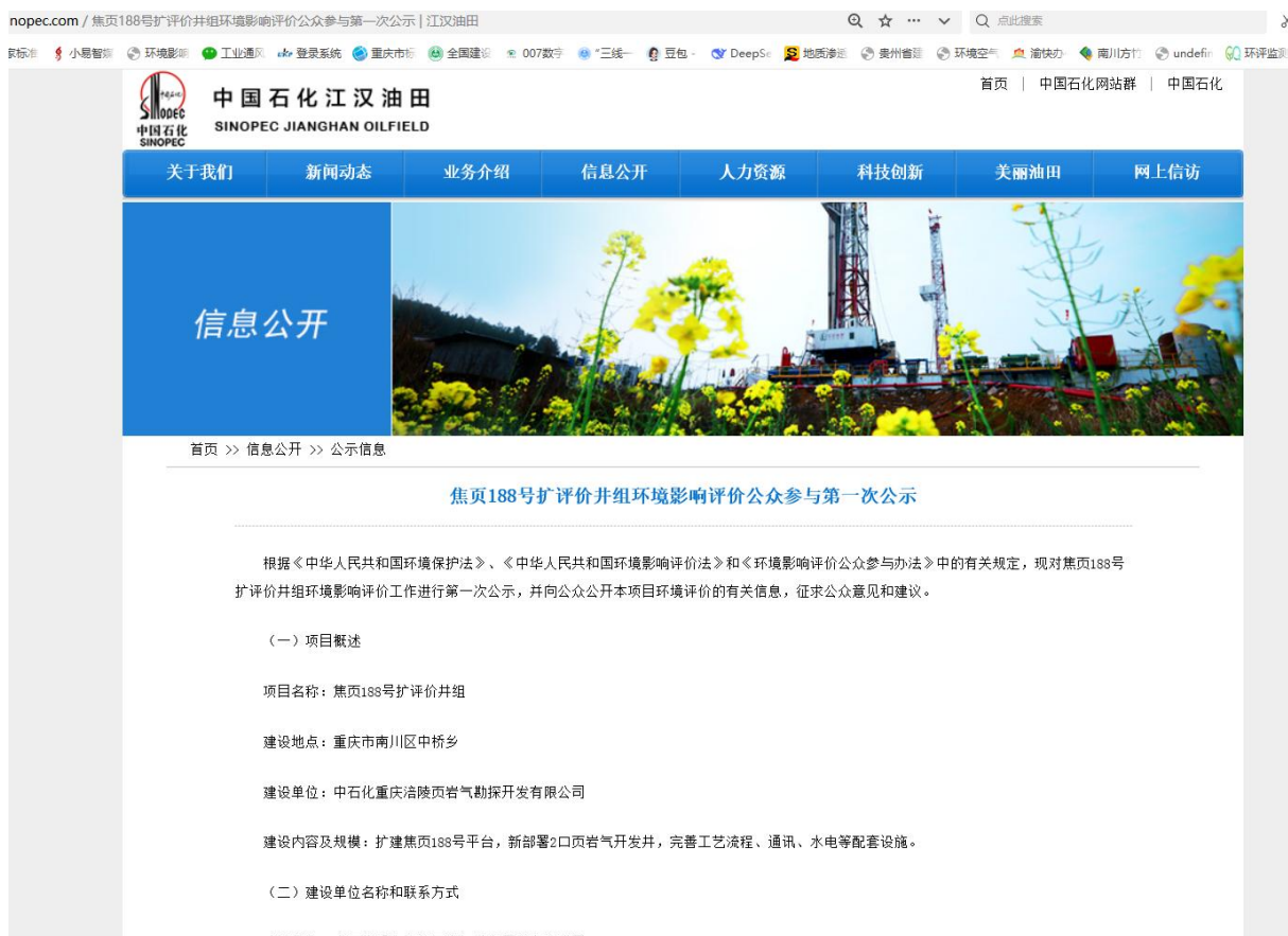
图 2.2-1 第一次网上公示