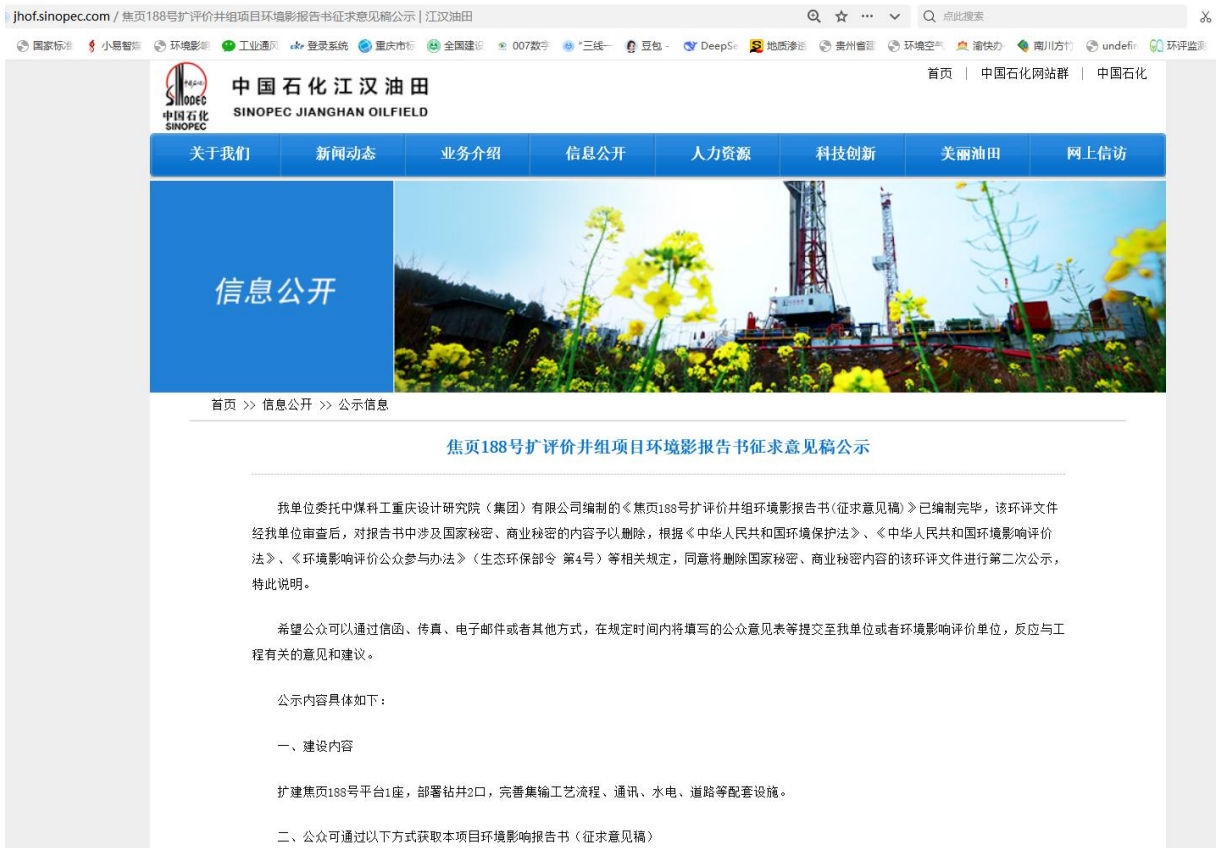
图 3.2-1 征求意见稿网上公示截图