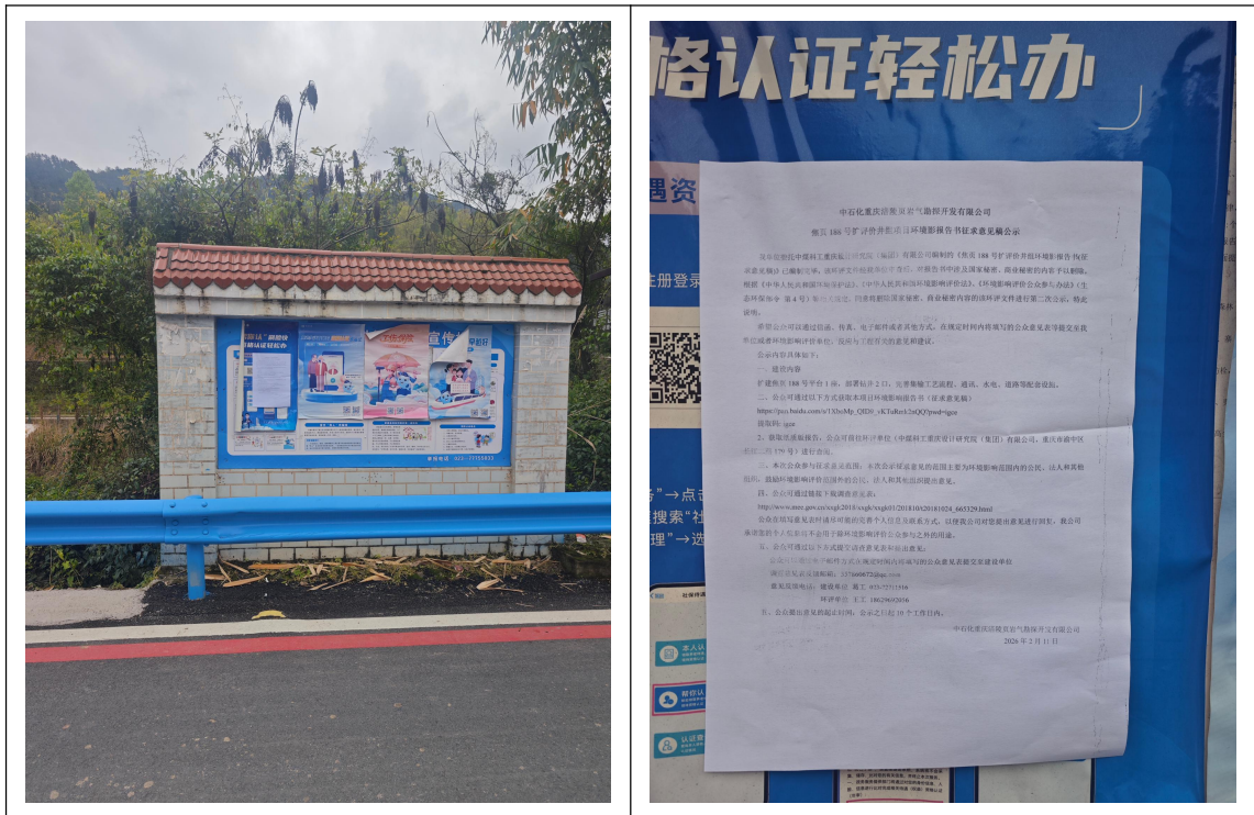
图 3.2-4 现场公示图片