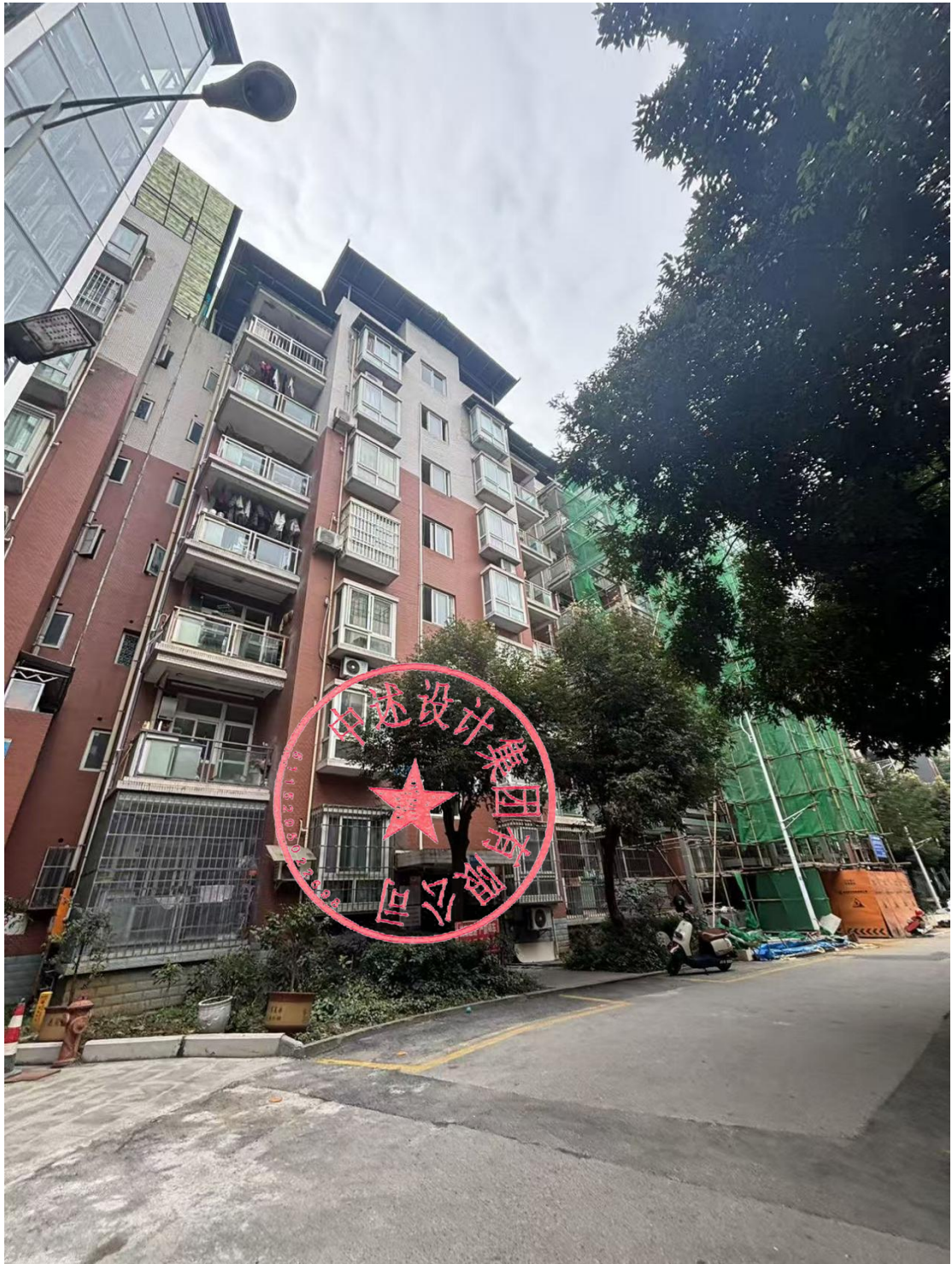
图 1-1 南川区金佛社区金易城市花园 7 栋 4 单元外观图